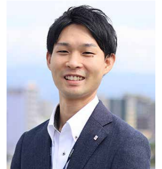
●2017年入庫 ●中小企業診断士資格取得

当金庫では資格取得の費用補助や外部団体への出向推進など、挑戦意欲のある職員を応援してくれる体制が整っており、恵まれた職場環境であることを実感しています。今後も、出向経験と実践で得た専門的知識を活用し、信用金庫職員としての立場と中小企業診断士としての立場の両視点から、地域に根差した経営支援を続けていきたいと思っています。