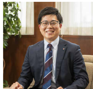
●2014年入庫 ●育休期間:1ヶ月

今後は私自身も沼津信用金庫の一員として、同じように育児休業を取得しようとする仲間を支え、誰もが安心して家庭と仕事を両立できる風土づくりに貢献していきたいと思っています。