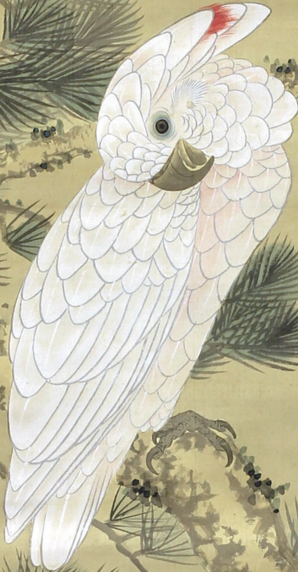
■江川坦庵「鸚鵡」(部分)