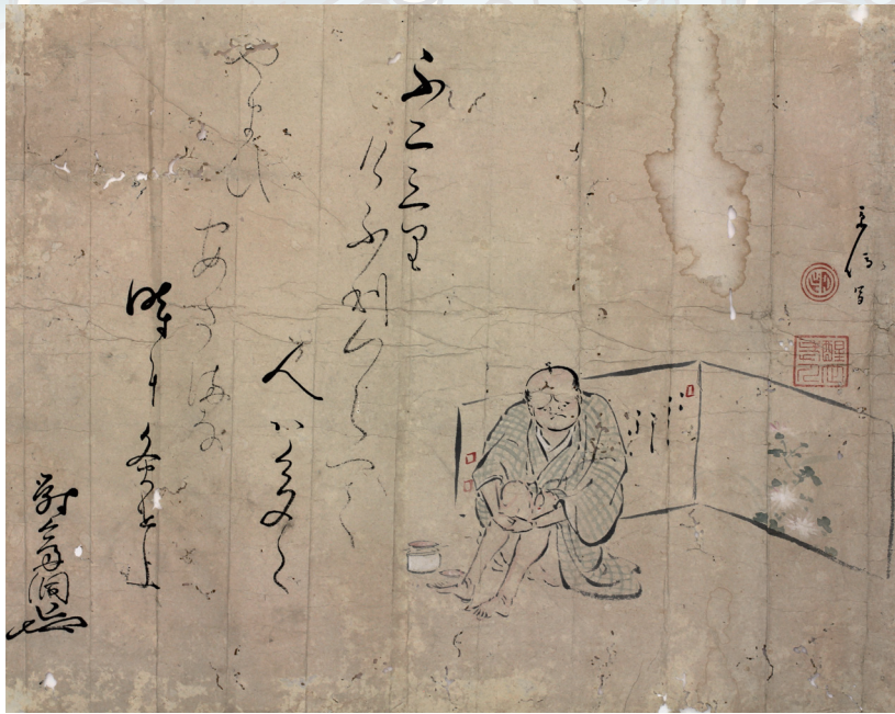
■山東京伝「人物画・狂歌」