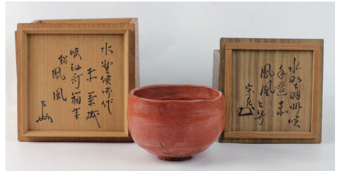
■水野出羽守作茶碗

※沼津市明治史料館は、施設の長寿命化を図る改修工事を行うため、次のとおり休館しています。